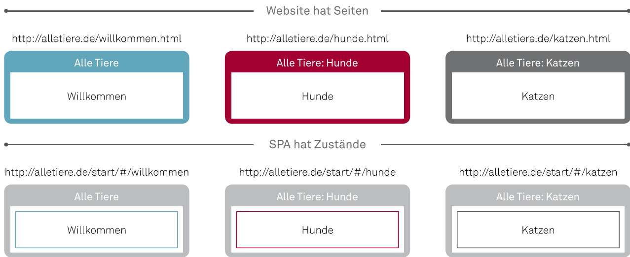
Abbildung 3: Bei SPAs werden alle Inhalte zustandsgesteuert auf einer Webseite dargestellt

vor Probleme stellen und zu schlechten Ranking- oder Indizierungsergebnissen führen.