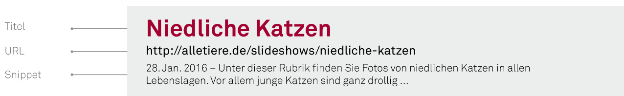
Abbildung 1: Suchmaschinenergebnisse bestehen in der Regel aus einem Titel, der URL und einem Snippet (Teaser)

für Nutzer und für das Ansteuern von Webseiten sind. In dieser Eye-Tracking- und Nutzerfreundlichkeitsstudie haben Nutzer in Suchergebnissen die relative Wichtigkeit von (Webseiten-) Titel, Teaser und URL beim Lösen gestellter Navigations- und Informationsaufgaben bewertet. Zusätzlich wurden die Augenbewegungen erfasst, um zu ermitteln, wie viel Zeit die Nutzer mit dem Lesen des Titels, des Teasers und der URL verbrachten (siehe Abbildung 2). Die Ergebnisse zeigten, dass die URL in der Tat ein wichtiger Bestandteil für die Bewertung der Qualität (Relevanz) von Suchergebnissen ist.